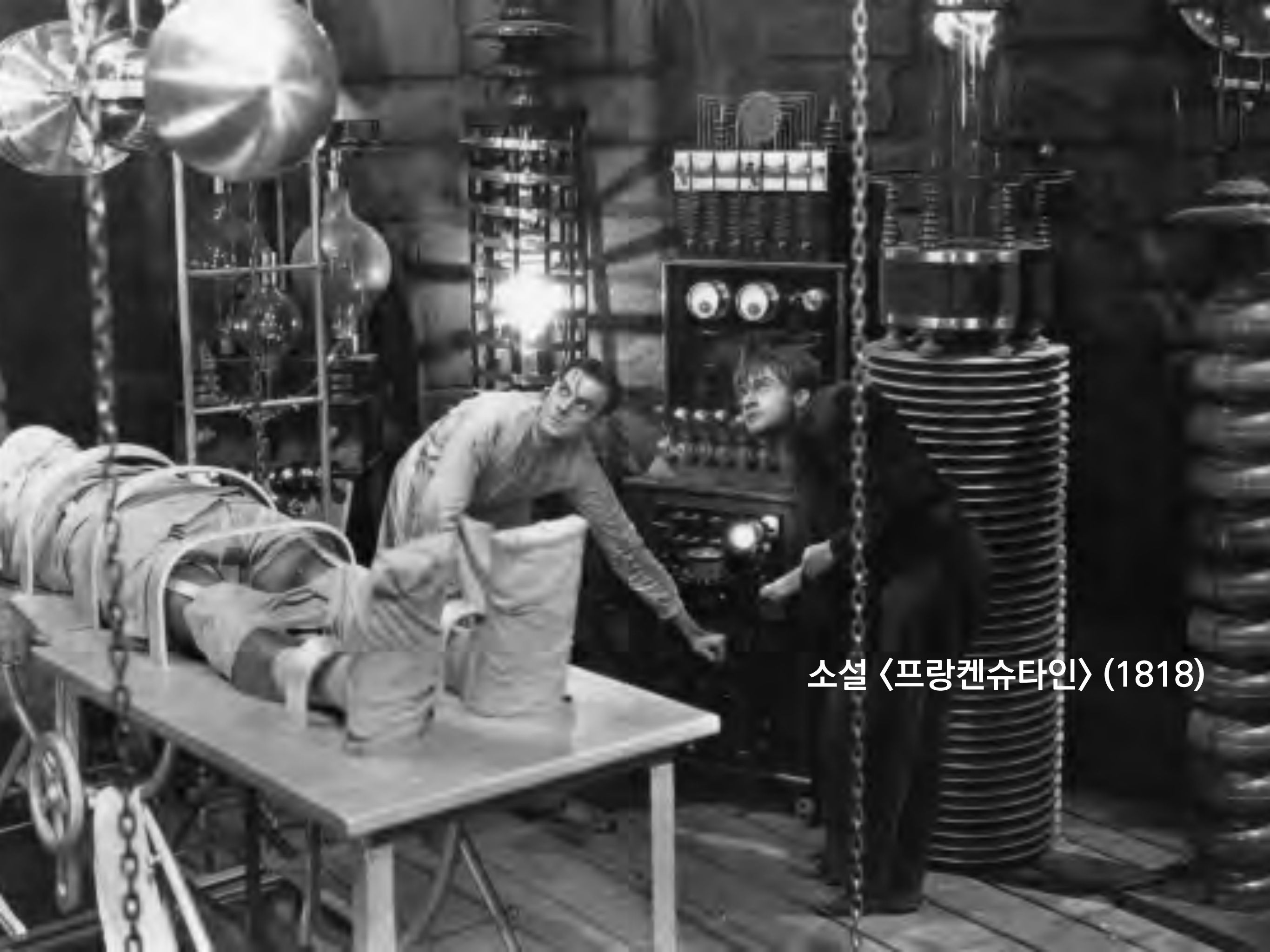
소설 〈프랑켄슈타인〉 (1818)